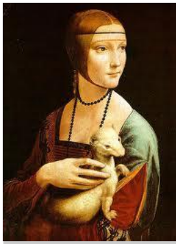
Dame à l'Hermine par Léonard de Vinci

Les proportions des belles , et des beaux d'antan et d'aujourd'hui ne sont pas constantes. Ainsi même Léonard de Vinci n'a pas hésité à trahir « l'homme de Vitruve » dans sa « Dame à l'Hermine » : les doigts de celle-ci sont exagérément longs.