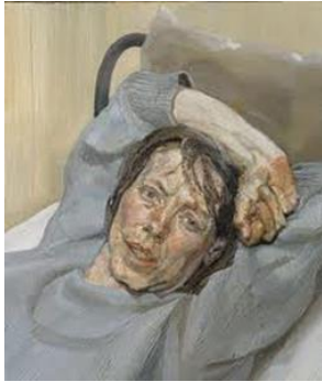
« Woman In A Grey Sweater » par Lucian Freud

Ces artistes vont radicalement à contre-courant des images de la mode actuelle qui, au contraire lissent, unifient, matifient les corps et les visages des mannequins à grands coups de Photoshop .