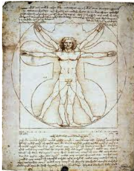
L'homme de Vitruve par Léonard de Vinci

En tout temps, nombreux peintres, philosophes, mathématiciens, se sont penchés sur les critères de la beauté. Symétrie ou dissymétrie ? Dans l'Antiquité, les premiers pythagoriciens 1 , pensaient que l'harmonie était un équilibre de contrastes. Les Anciens Grecs et après eux les peintres de la Renaissance, ont aussi essayé de dégager de « justes proportions ». C'est ainsi que le grec Vitruve 2 exprima la beauté en fractions : le visage doit être égal à \frac{1}{10} de la longueur totale de la personne, la longueur du thorax à un \frac{1}{4} de la grandeur totale, etc. Plus tard, Léonard de Vinci en a réalisé un célèbre dessin à la plume intitulé « Étude des proportions du corps humain selon Vitruve ».